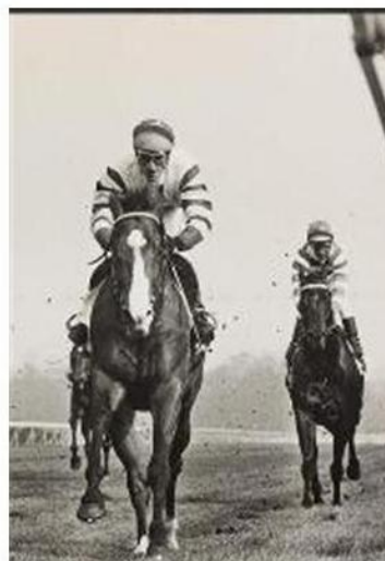
A sinistra e a destra, le corse al trotto e al galoppo negli anni Settanta In basso a sinistra le tribune di San Siro gremite per l'apertura del nuovo Ippodromo di San Siro negli anni Venti e una corsa sempre in quegli anni Qui sotto, l'inaugurazione della pista da trotto di Turro, nel 1905