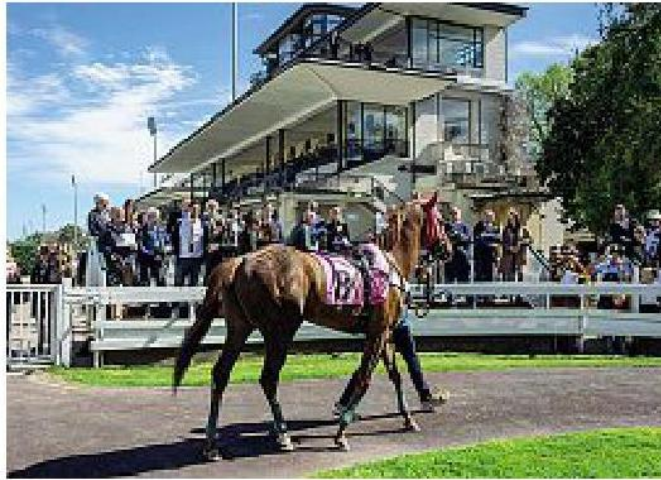
Doppio evento Festa per la 136esima stagione del galoppo e il nuovo archivio

L a stagione del galoppo numero 136 a San Siro parte dall'inaugurazione del progetto «Archivio Storico Ippodromi Snai», grande opera di organizzazione, catalogazione e selezione di documenti, fotografie, disegni e immagini sulla storia dell'ippica, fruibile anche online.