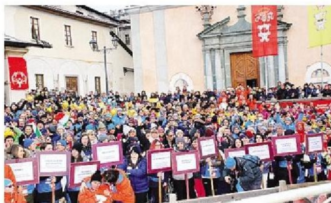
Una piazza gremita da atleti, accompagnatori e famiglie