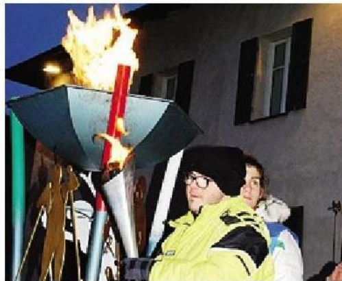
Bormio, aperti i giochi in una piazza gremita

Lo ha fatto ieri sera poco prima delle 18 in una piazza del Kuerc di Bormio gremita all'inverosimile, con migliaia di persone pronte ad applaudire: presenti le primarie e secondarie di primo grado di tutto il mandamento, i circa cinquecento atleti che parteciperanno ai giochi ed i loro accompagnato-