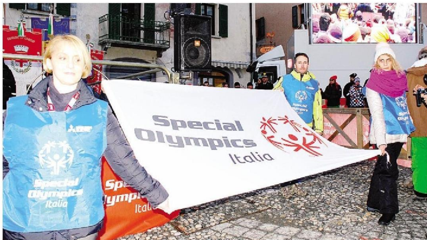
Aperta ufficialmente a Bormio la ventottesima edizione dei giochi nazionali invernali Special olympics

mila Marco Confortola che ha sottolineato la passione e la voglia di fare che caratterizzano questa manifestazione.