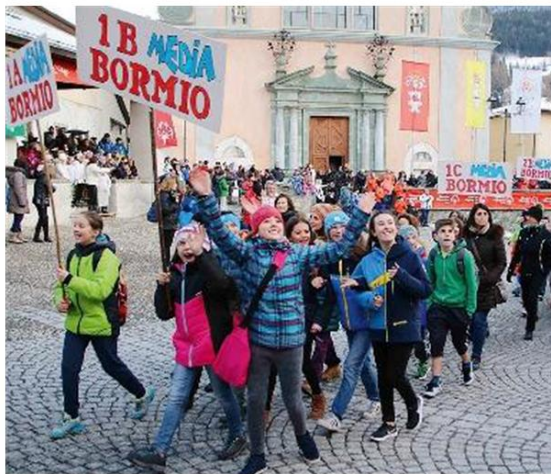
La presentazione della rassegna è stata a Bormio

LA TAPPA valtellinese (che si concluderà il 10 febbraio) rappresenta per 34 degli atleti in gara un importante momento di preparazione anche in vista dell'evento di più larga scala, i Giochi Mondiali, che si svolgeranno in Austria dal 14 al 25 marzo: a ricordarlo, il presidente di Special Olympics Italia, Maurizio Romiti, in occasione della conferenza stampa che