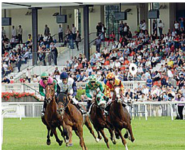
Il galoppo milanese riparte oggi con il Premio d'Apertura PERRUCCI